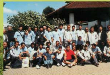
Erfolgreiche Trainingsaufenthalte im Ringhotel Krone. Oben: Galatasaray Istanbul. Unten: die Nationalmannschaft des Iran.